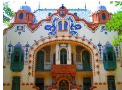
Első nemzetközi konferencia a kulturális turizmusról Subotica (Szabadka) 2009