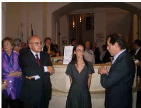
Tanácsadó Testületi Ülés Málta 2009