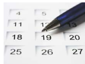
Emlékezzünk rá, hogy... Rejtett évfordulóink