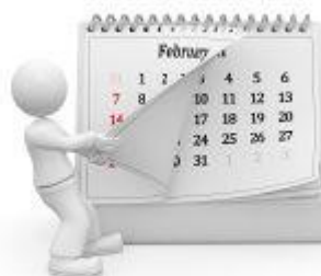
Előjegyezhető 2017-es programok