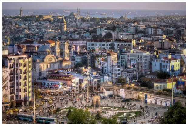
Beszámoló az ICOMOS Tanácsadó Testületi ülésről és Éves Közgyűlésről