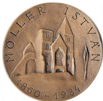
Felhívás Möller Emlékérem adományozására

Beszámoló a 18. Tuszáni Konferenciáról Kolozsvár - 2016. október 26-29