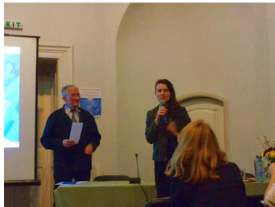
Műemlékek és a műemléki helyszínek rekonstrukciója

Beszámoló a 18. Tuszáni Konferenciáról Kolozsvár - 2016. október 26-29